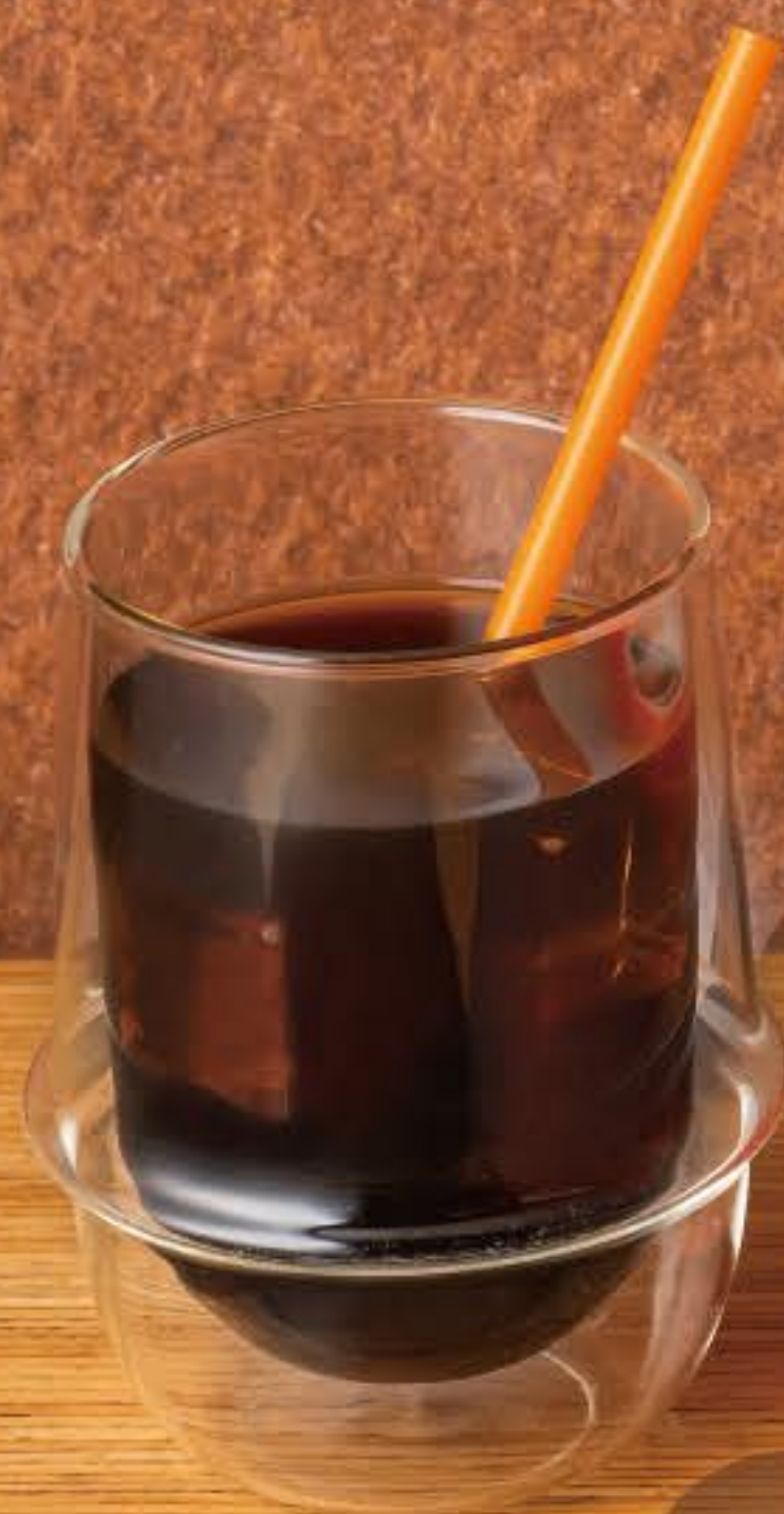
アイスアメリカーノ

珈琲の焙煎専門店「Koenbench」様と弊社社長が共同で開発した敷島堂オリジナルブレンド。一流のバリスタとお菓子を熟知した職人が、豆の配合や焙煎度合い、粒度等を徹底的に話し合い、幾度もテイस्टィングを経てお菓子をもっと美味しく感じられる珈琲をおつくりしました。