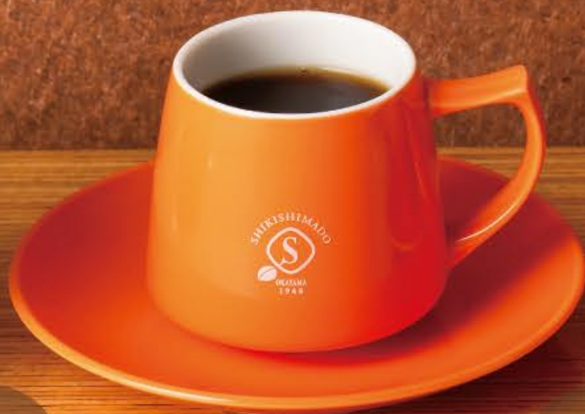
シキシマドウブレンド